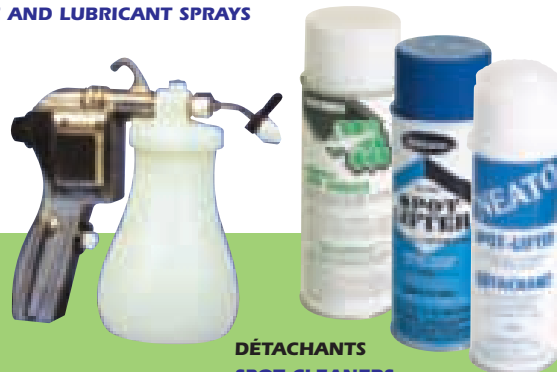
DÉTACHANTS SPOT CLEANERS