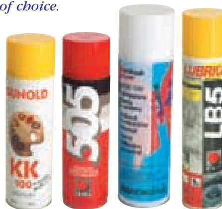
VAPORISATEURS LUBRIFIANTS ET ADHÉSIFS ADHESIVE AND LUBRICANT SPRAYS

A specially designed electric razor to remove embroidery mistakes without damaging the fabric. Every shop should have one in their quality control department!